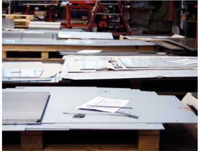
■ AMS Laserzentrum