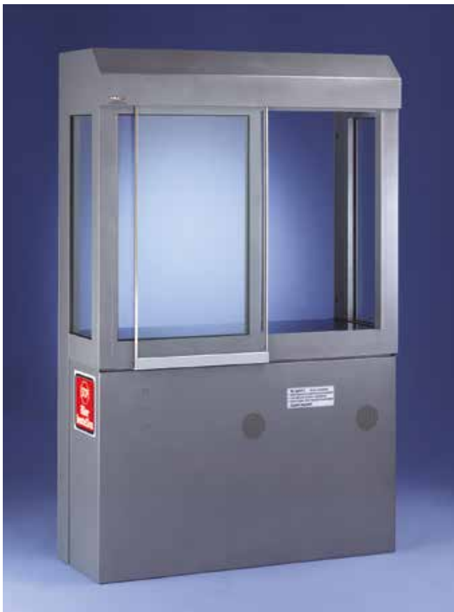
■ Ausgabeschalter Typ 8700