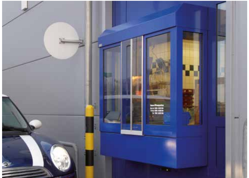
■ Ausgabeschalter Typ 8550