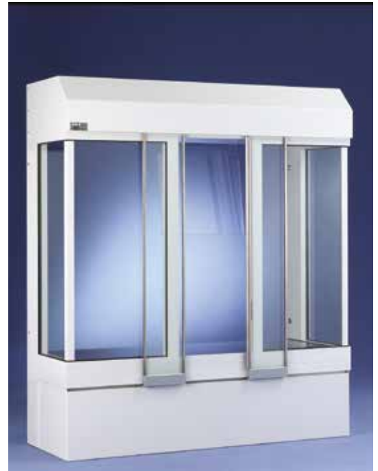
Ausgabeschalter Typ 8600 (unten)

Die Ausgabeschalter der klassischen Baureihe 8000 unterscheiden sich von der 7000er Serie vor allem in ihrer Optik und ihrer zum Innenraum ausgerichteten Bauart. Ihre starken und gedämmten Aluminiumrahmenprofile erfüllen die Anforderungen der Energiesparverordnung EnEV. Die Schiebelemente aus 8 mm Verbundsicherheitsglas und die technischen Antriebs- und Steuereinheiten sind in die jeweiligen Rahmen integriert. Das Öffnen und Schließen erfolgt automatisch über einen Annäherungsschalter. Die Ausgabeplatte aus Edelstahl verfügt über eine zuschaltbare Heizung. Der Ventilator ist wahlweise von Hand oder über eine Steuerung regelbar. Auch sind eine Umschaltmöglichkeit auf Handbetrieb und eine Sperrschaltung über einen Drehschalter eingebaut. Die Rahmen sind in verschiedenen Standardabmessungen erhältlich. Sonderanfertigungen sind jederzeit möglich. Alle Rahmenteile werden kunststoffpulverbeschichtet. Der Farbton kann individuell nach RAL gewählt werden.