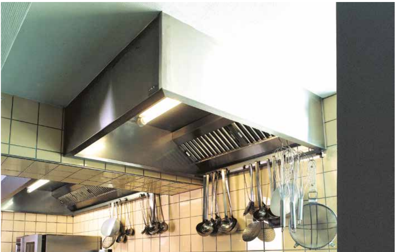
■ Raststätte, Reinhardshain