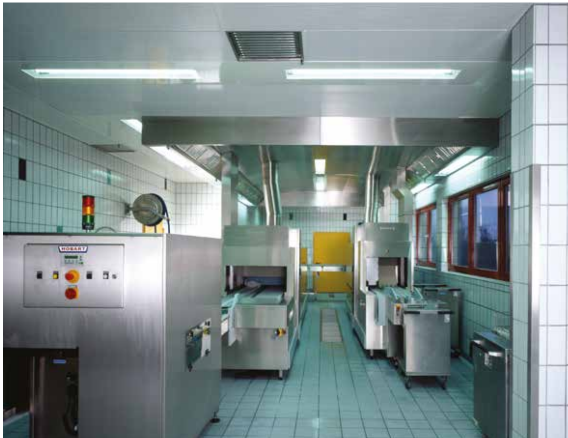
■ Uniküche Düsseldorf