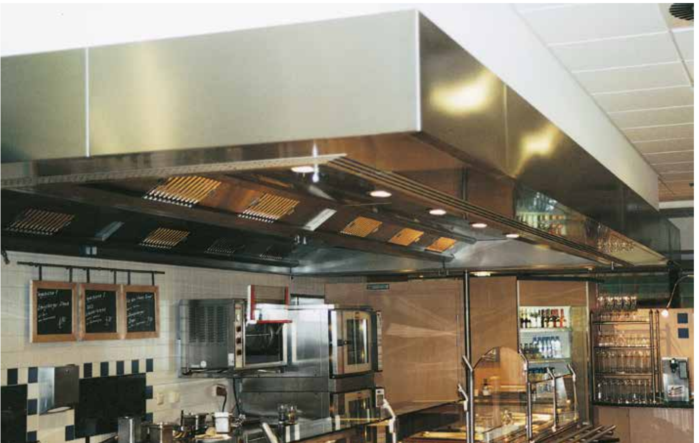
■ Haco-Center, Wadern