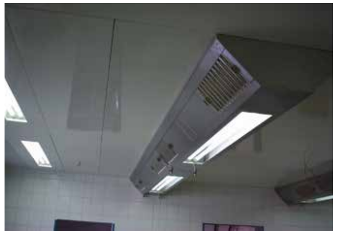
■ SEW Bruchsaal