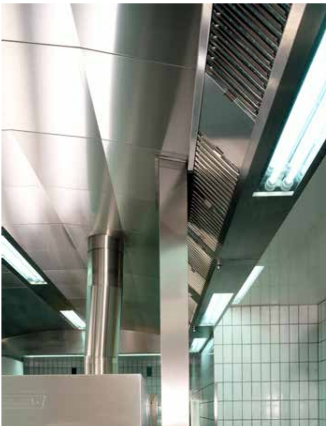
■ CNS Randabsaugerbalken