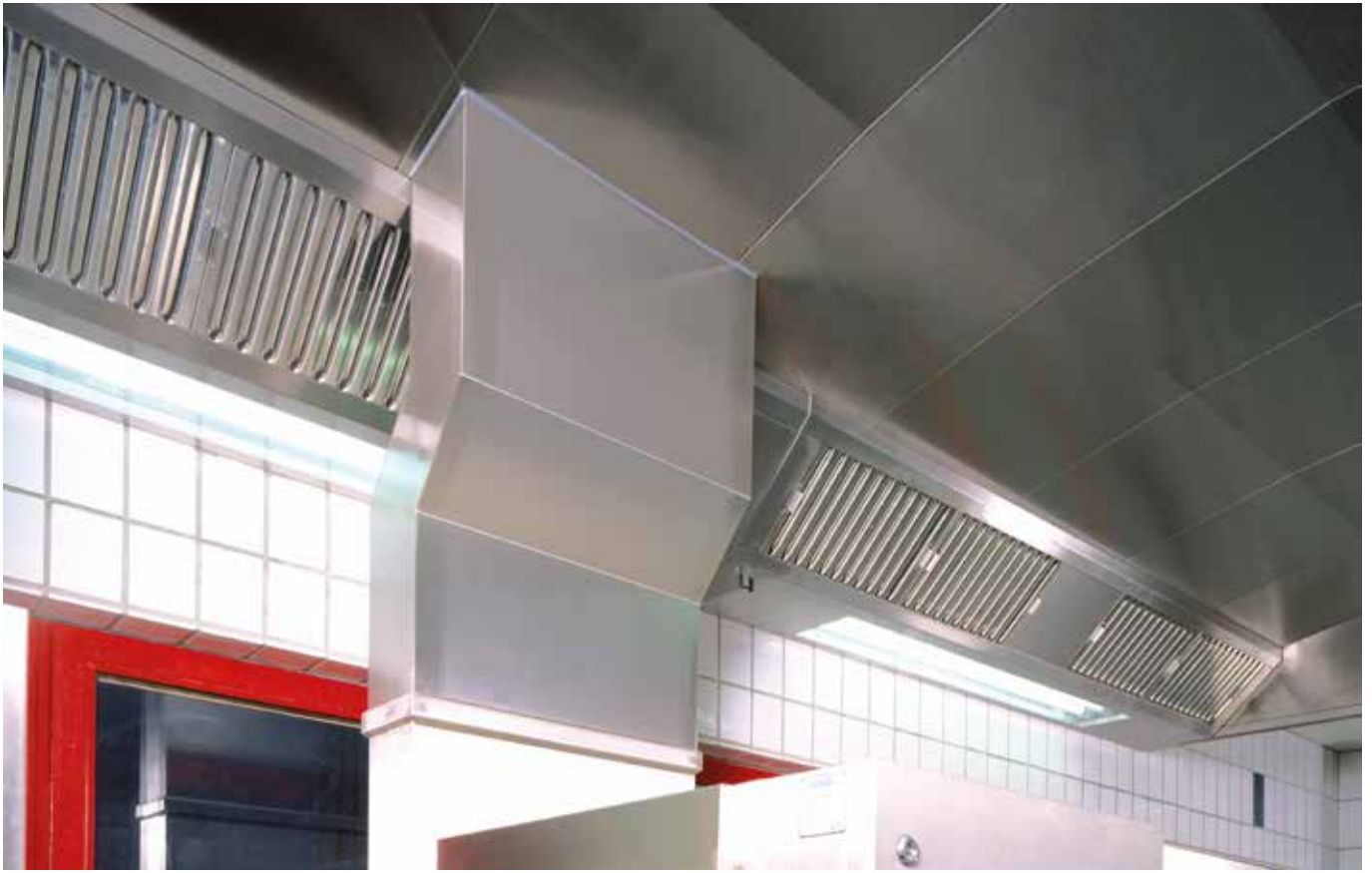
■ CNS Medienkanal